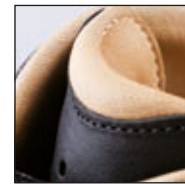
Doublure intérieure en cuir très souple