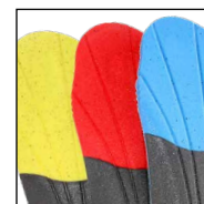
Système de maintien de la voûte plantaire HAIX® AS