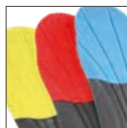
HAIX® Vario Wide Fit System