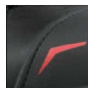
Protection de l'embout de sécurité avec encoche pour coutures