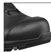
HAIX® Composite toe cap