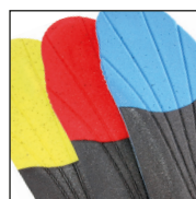
HAIX® Vario Wide Fit System