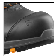
HAIX® Composite Toe Cap