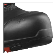
HAIX® Composite Toe Cap