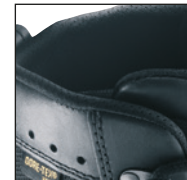
Fermeture de tige