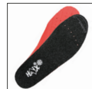
Perfect fit winter semelle