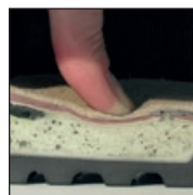
Système de mousse injectée HAIX® MSL