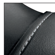
Protection de l'embout de sécurité avec encoche pour coutures