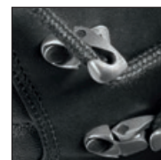
Crochets à fermeture automatique