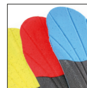
HAIX® Vario Wide Fit System