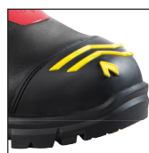
HAIX® High Durability Cap System