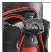
HAIX® FL Fit System