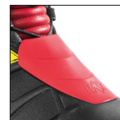
HAIX® 3Z Protector System