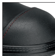
Protection de l'embout de sécurité avec encoche pour coutures