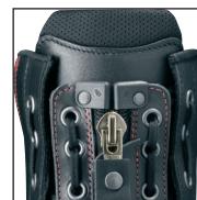
Système de laçage HAIX® Lacing