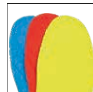
HAIX® Vario Wide Fit System