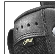
Matériau de grande qualité