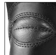
Protection du tendon