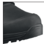
Protection supplémentaire des orteils