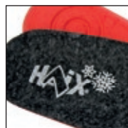
Semelle intérieure d'hiver certifiée