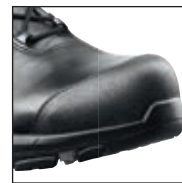
HAIX® Composite Toe Cap