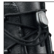
HAIX® Smart Lacing