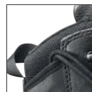
HAIX® Climate System