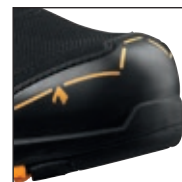
HAIX® Composite Toe Cap