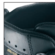
Matelassage agréable du haut de la tige