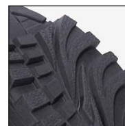
Semelle en TPU 3 phases