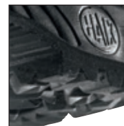
Profil de la semelle