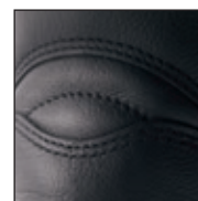
Protection du tendon